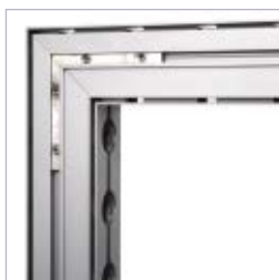
Hjørne med samleled