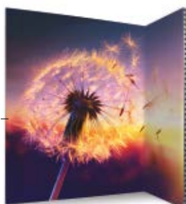
Ramme 992 x 992 mm